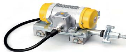
MODELOS VIBRADORES EXTERNOS