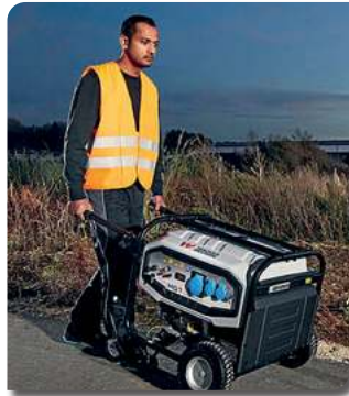
GENERADORES PORTÁTILES BENCINEROS