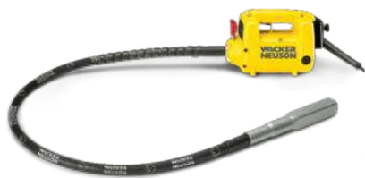
MODELO VIBRADOR DE INMERSIÓN