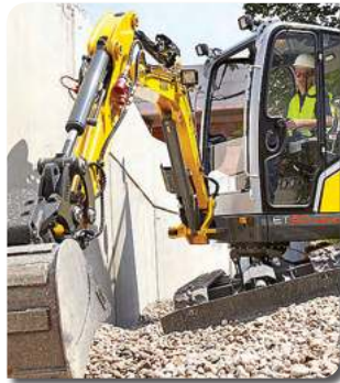
CORTADORA DE PAVIMENTO