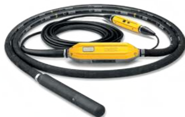
MODELOS VIBRADORES INTERNOS