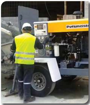
BOMBAS PARA HORMIGÓN