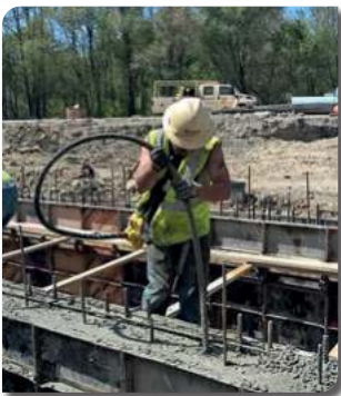
VIBRADORES DE INMERSIÓN

Te ayudamos a construir soluciones con equipos para todas las etapas de tu proyecto, encuentralos en nuestras sucursales y red de distribuidores a nivel nacional