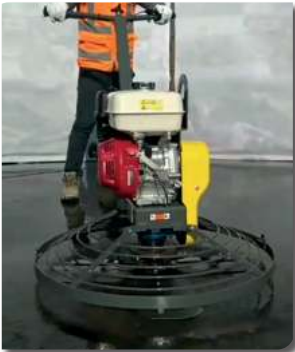
ALISADORA DE PAVIMENTO