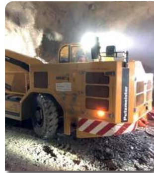
CAMIÓN PERFIL BAJO