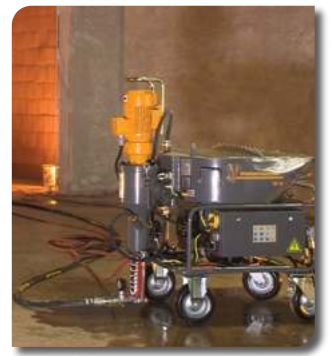
INYECCIÓN Y MORTERO